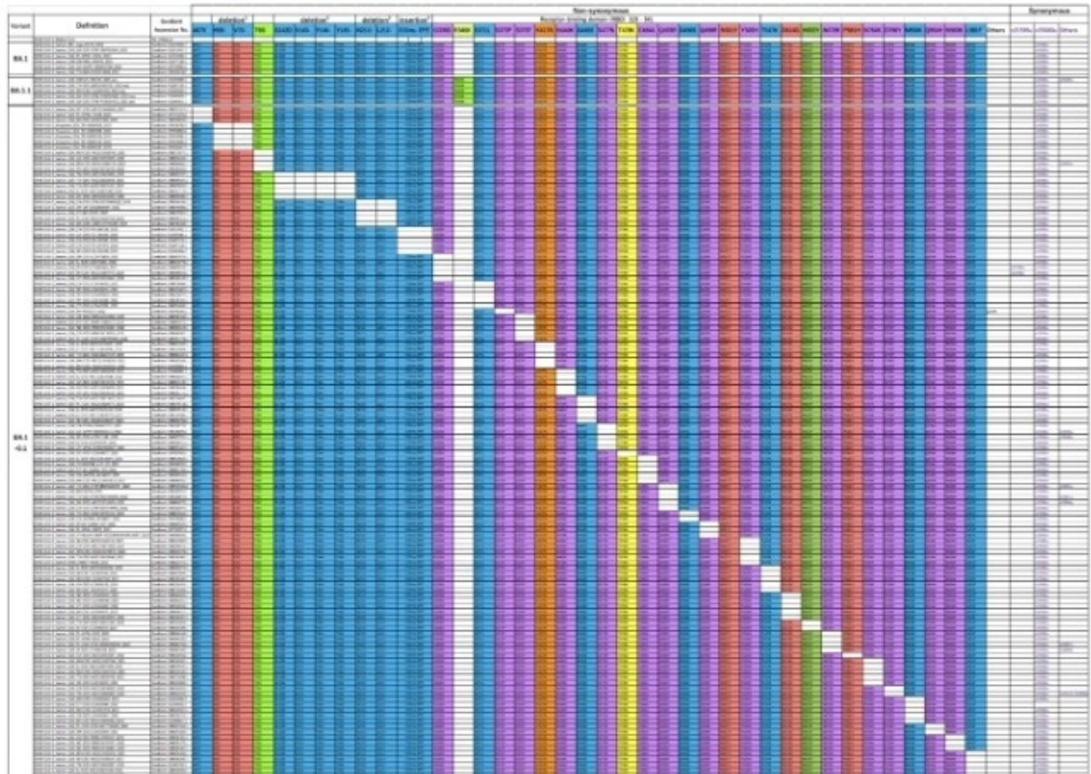
Fig. 2 A

In einem separaten Artikel, in dem die Ergebnisse analysiert wurden , hieß es: