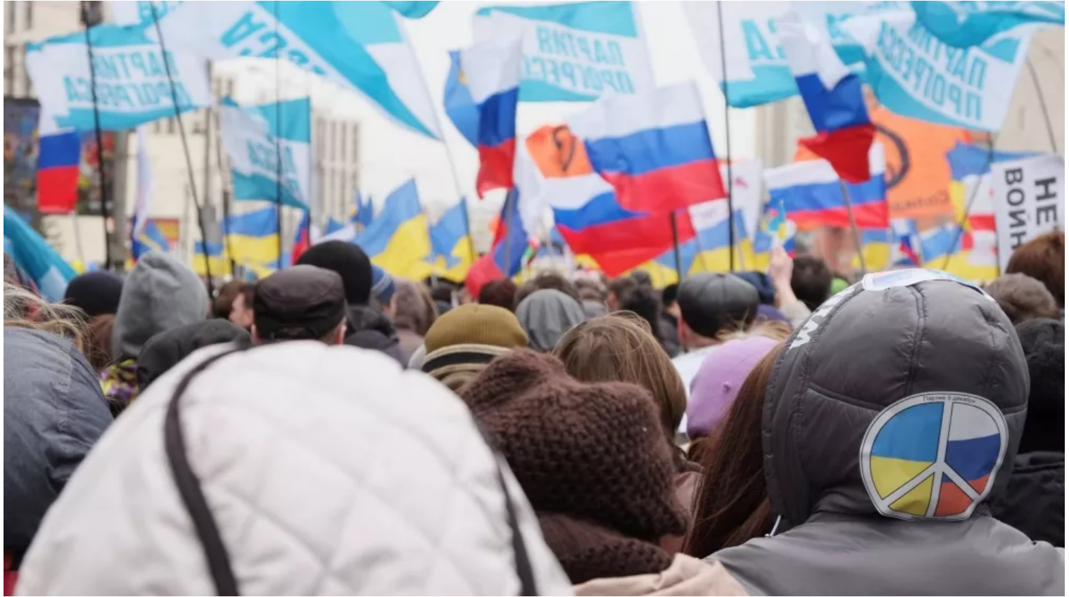
Moskauer protestieren am 15. März 2014 auf den Circular Boulevards in Moskau gegen den Krieg in der Ukraine und Russlands Unterstützung des Separatismus auf der Krim.

Das schwindende Vertrauen in das russische Wahlsystem wäre aufgrund der staatlichen Kontrolle über die meisten Medienquellen schwierig. Dies könnte die Unzufriedenheit mit dem Regime verstärken, aber es besteht die ernsthafte Gefahr, dass der Kreml die Repression verstärkt oder um sich schlägt und einen Ablenkungskonflikt im Ausland führt, der den Interessen des Westens zuwiderlaufen könnte.