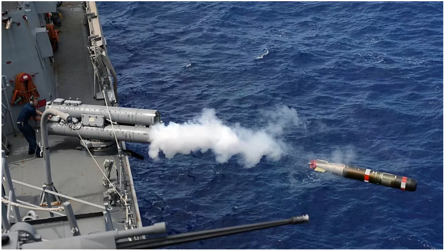
Ein US-Seemann an Bord des Lenkwaffenzerstörers USS Mustin (DDG-89) feuert während Valiant Shield 2014 im Pazifischen Ozean am 18. September 2014 einen Torpedo auf ein simuliertes Ziel ab.