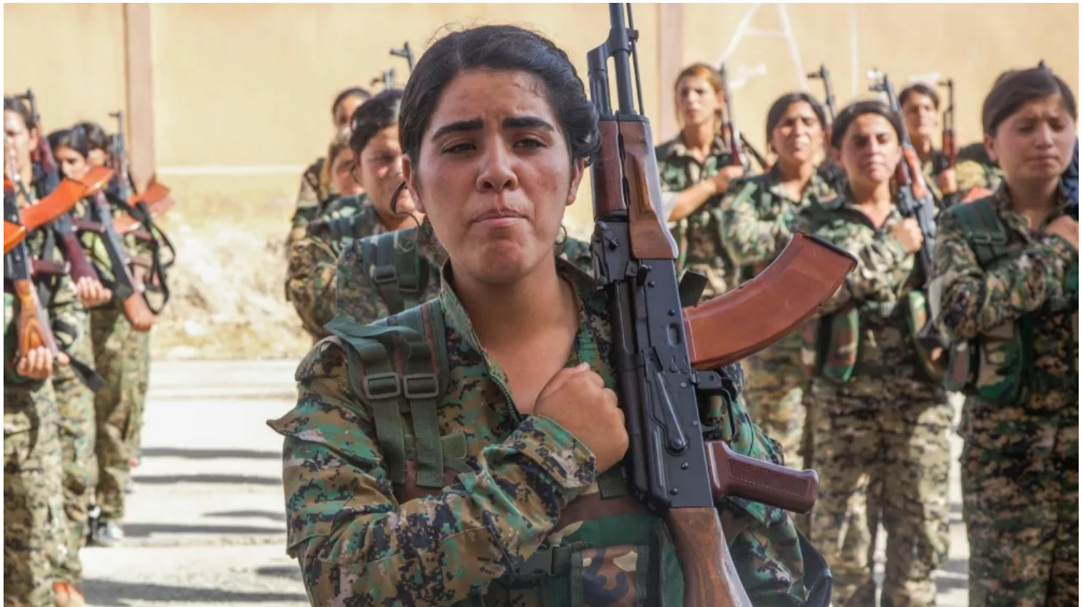
Azubildende der Demokratischen Kräfte Syriens, die eine gleiche Anzahl arabischer und kurdischer Freiwilliger vertreten, stehen bei ihrer Abschlussfeier in Nordsyrien am 9. August 2017 in Formation.