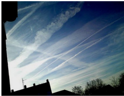
Abb. 186 und 187: Typisch sind Kreuz- und Schachbrettmuster, damit die ausdehnenden Streifen eine zugezogene Wolkendecke bilden. Sagen Sie mir bitte nicht, dass Sie solch ein Phänomen bei sich in der Gegend noch nie beobachtet haben. Ich sehe das bei mir fast täglich, und das seit vielen Jahren.