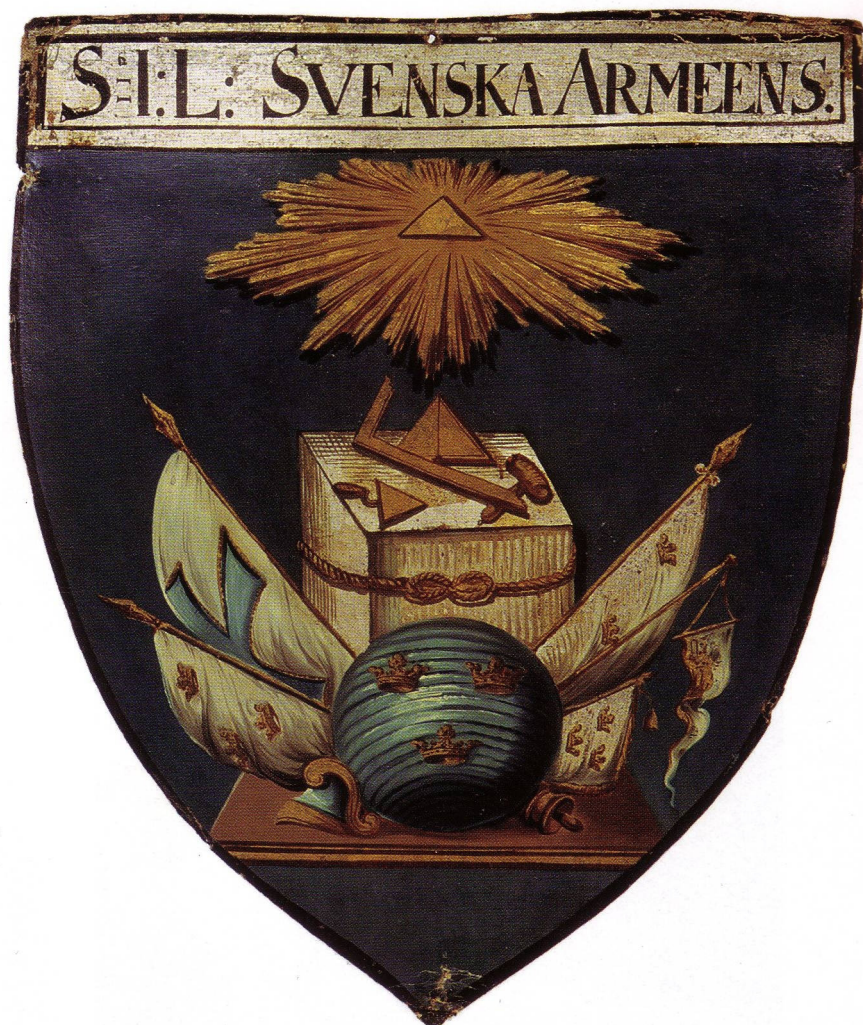
Abbildung 1: Das Wappen der schwedischen Militärloge Svenska Arméens Loge sowie ihr Altar befinden sich im Museum der Provinzialloge Värmland in Karlstad. (Museum der Provinzialloge Värmland, Karlstad, Schweden)

Aufgrund der desolaten Kriegsführung gegen Preußen wurde unter Vermittlung des Stralsunder Freimaurers Adolf Friedrich von Olthof am 22. Mai 1762 in Hamburg ein Separatfrieden geschlossen. 33 Olthof war in den 1750er Jahren in Stockholm gewesen und wurde 1761 in die französischsprachige Loge L'Union aufgenommen. 34